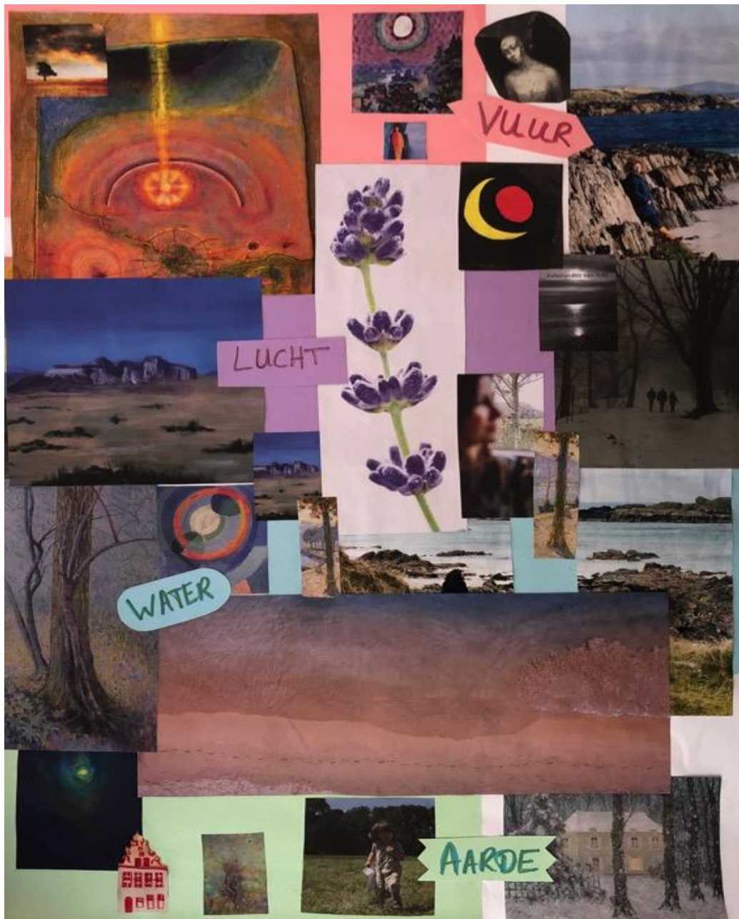
Figuur 1 Verbeelding van vierledig mensbeeld Van Sandick 2019

Op de volgende bladzijde tref je een typering aan van het vierledig mensbeeld. Door op de link naar podcast te klikken kom je bij geluid bij het liedje en een gesproken tekst. Zo kan je je verdiepen in hoe de vierledigheid bedoeld is en je mensenkennis vergroten.